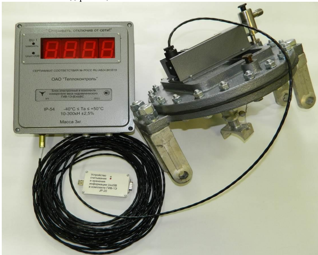
Общий вид измерителя веса гидравлического электронного ГИВ-1Э

Обработка метрологических данных происходит на основе жестко определенного алгоритма без возможности его модернизации.