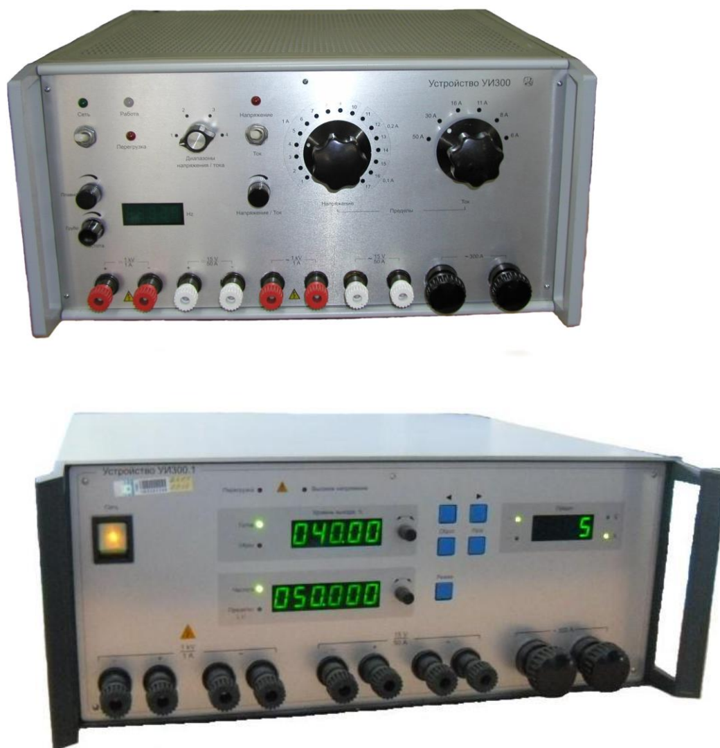
Рисунок 1 - Общий вид устройств