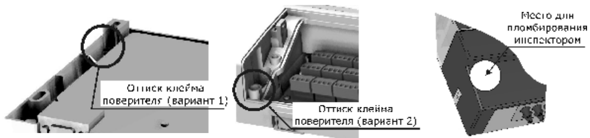
Рисунок 3 – Места пломбирования тепловычислителя