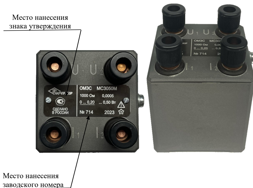
Рисунок 2 – Общий вид MC3050M-2