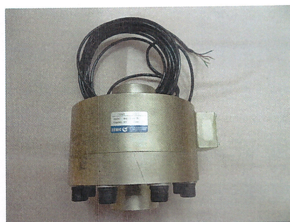
Рисунок 3 – Датчик силы H2D-C2