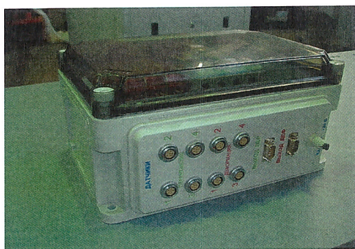
Рисунок 4 – Блок НУТ-8