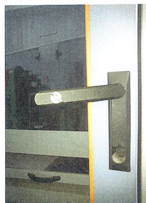
Рисунок 5 – Внешний вид замка на дверце стойки управления