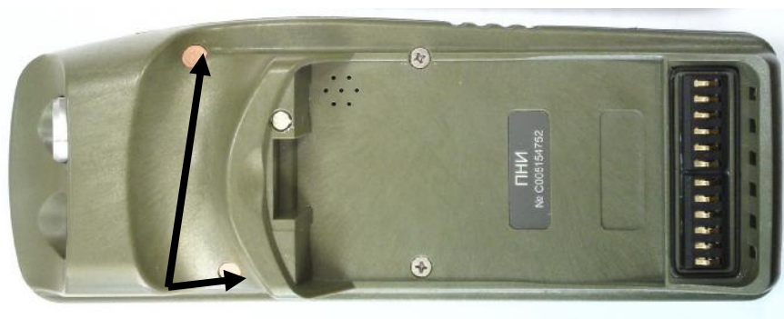
Рисунок 3 - Места пломбировки от несанкционированного доступа