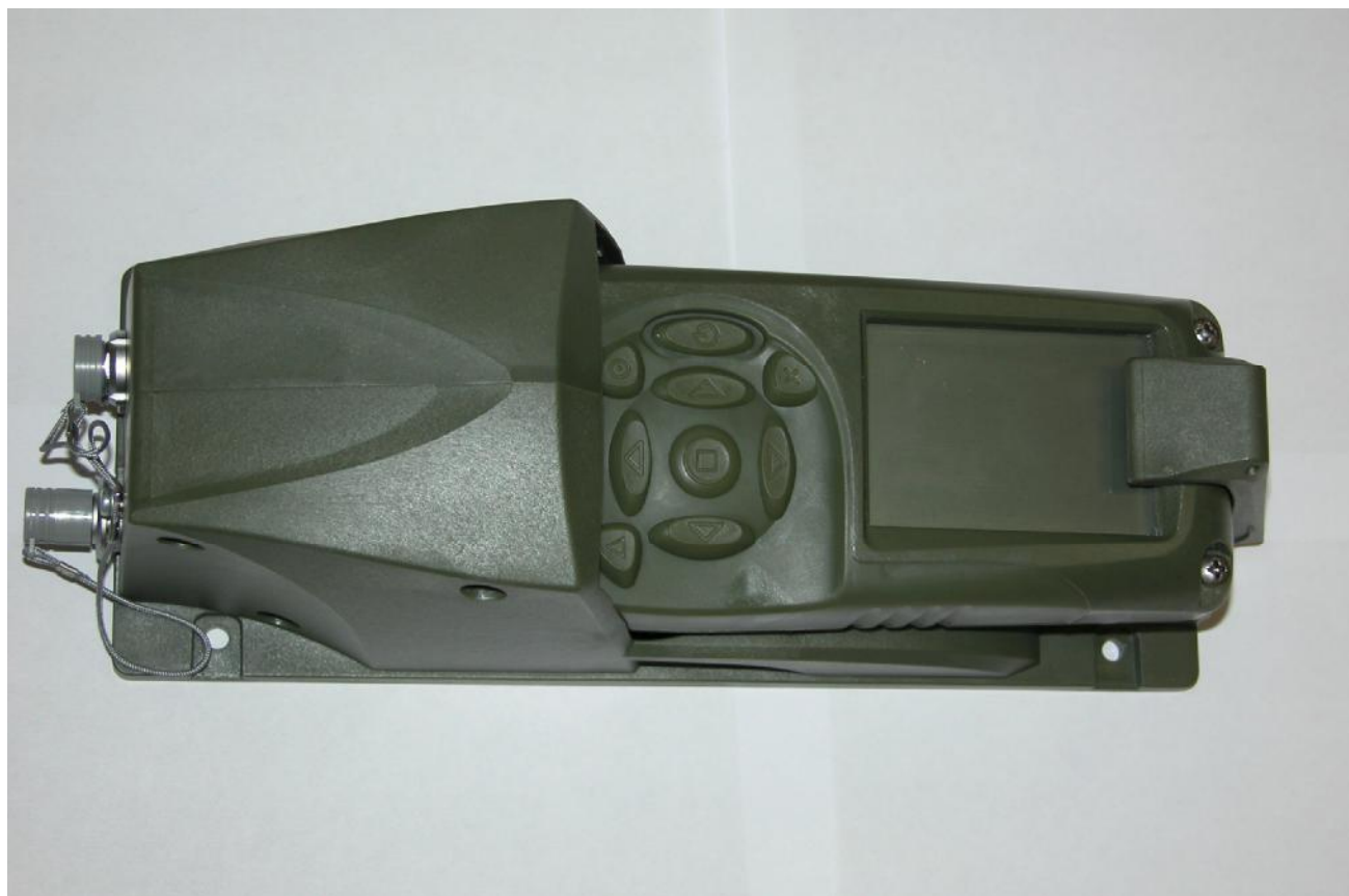
Рисунок 1 – Внешний вид аппаратуры (ПНИ с АБ)