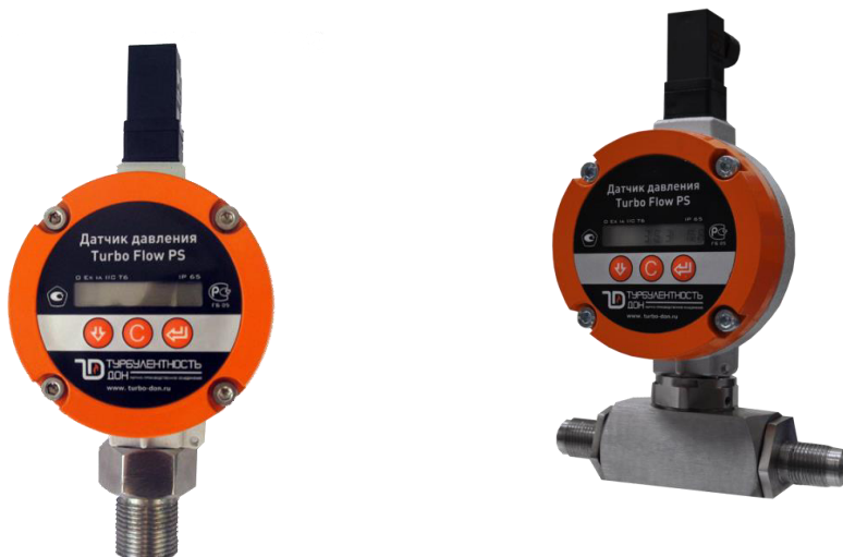
Рисунок 1 – Датчики давления Turbo Flow PS

Внешний вид датчиков давления приведен на рисунке 1