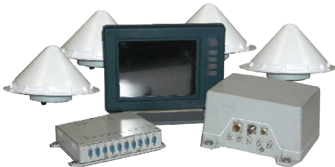
Рисунок 1 – Внешний вид аппаратуры

Места пломбировки от несанкционированного доступа приведены на рисунке 3.