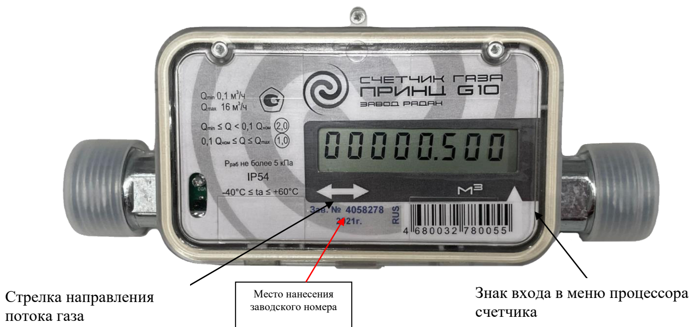
Рисунок 2 – Общий вид счетчика газа «Принц»

Общий вид счетчика газа «Принц» представлен на рисунке 2.