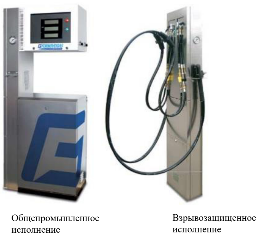
Рисунок 1. Внешний вид заправочной колонки