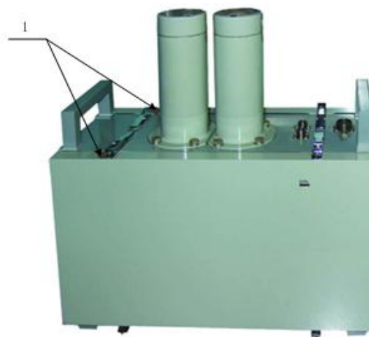
1 – Пломбы с оттиском клейма поверителя Рисунок 5 – Общий вид блока БДАС-03И