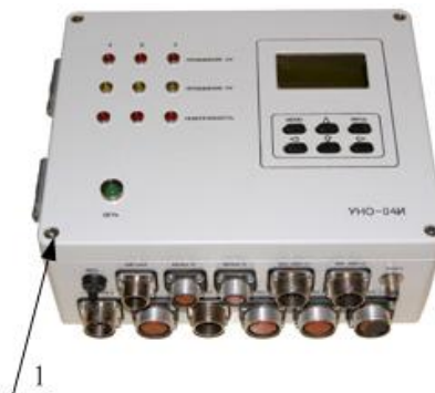
1 – Пломба с оттиском клейма поверителя Рисунок 4 – Внешний вид блока УНО-04И