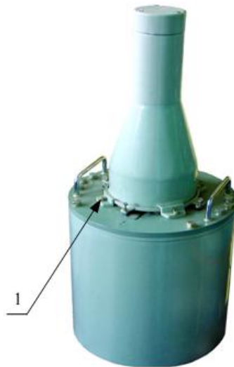
1 – Пломба с оттиском клейма поверителя Рисунок 3 – Внешний вид БДГБ-03И