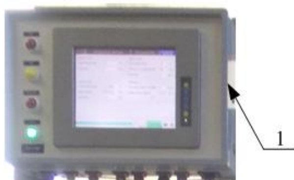
1 – Пломбы с оттиском клейма поверителя