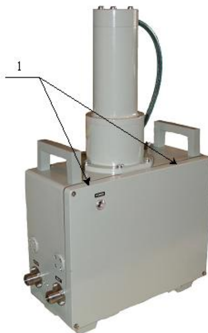
1 – Пломбы с оттиском клейма поверителя Рисунок 6 – Общий вид блока БДАС-01И