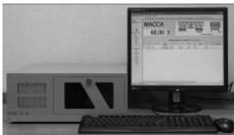
Рисунок 2 – Общий вид (пример) индикаторов М1РС-01 и терминалов М1РС-03 (слева)