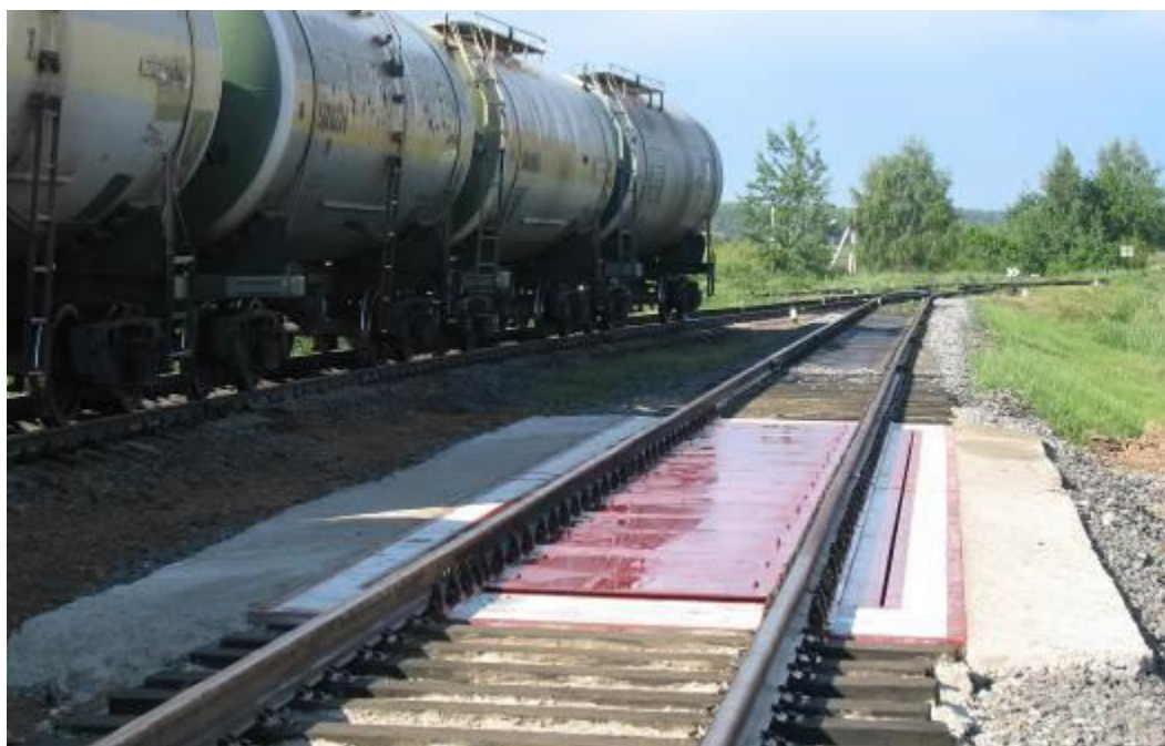
Рисунок 1 – Общий вид ГПУ средств измерений (пример)

Общий вид ГПУ представлен на рисунке 1, приборов весоизмерительных М1РС-01 и М1РС-03 – на рисунке 2. Схема пломбировки от несанкционированного доступа приведена на рисунке 3.