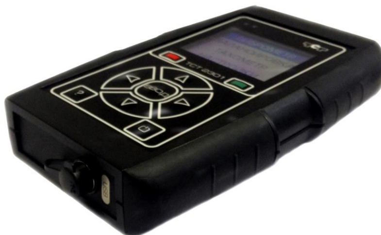
Рисунок 1. Внешний вид