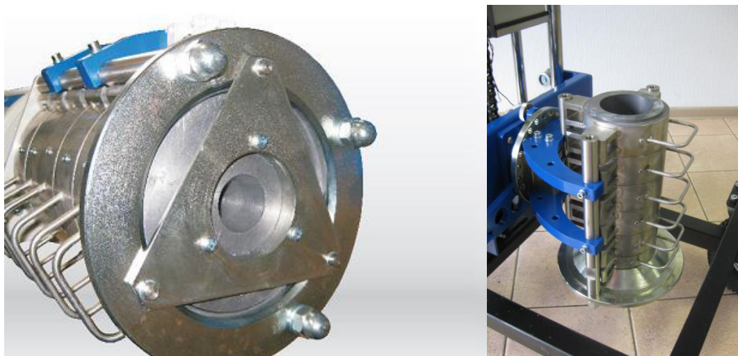
Рисунок 4 - Внешний вид съемных коллиматоров толщиной 100 мм и 50 мм для модификации DIGIBASE CART.