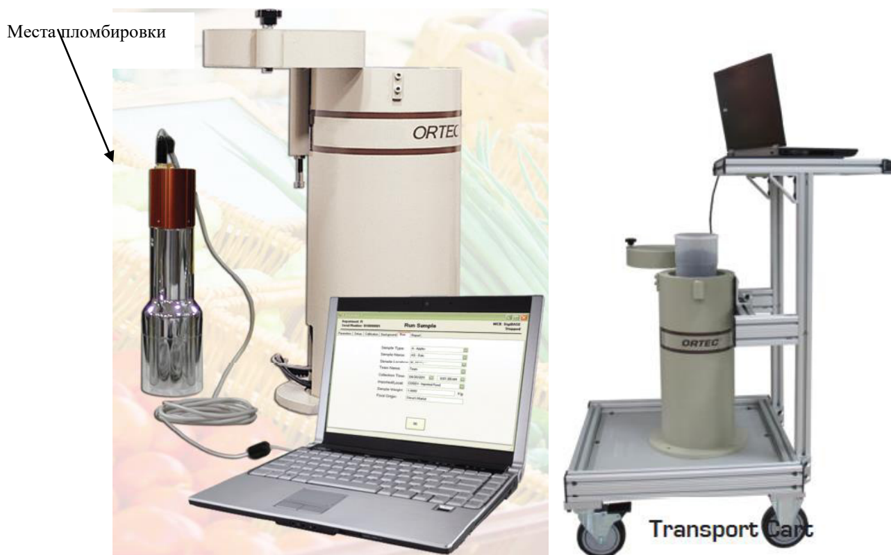
Рисунок 2 - Внешний вид установки DIGIBASE FOODGUARD в комплектации с настольной низкофоновой защитой LEAD SHIELD G-5 и тележкой FG CART.

На стойках передвижной платформы (рисунок 3) размещены устройства подъема и поворота, служащие для наведения блока детектирования на измеряемый объект. На полках передней стойки размещены ноутбук. БД с многоканальным цифровым анализатором DIGIBASE размещены внутри свинцовой защиты с коллиматором. На боковой поверхности блока свинцовой защиты с коллиматорами размещен лазерный дальномер-указатель, служащий для точного наведения блока детектирования на измеряемый объект и измерения расстояния до измеряемого объекта. Внешний вид съемных коллиматоров приведен на рисунке 4.