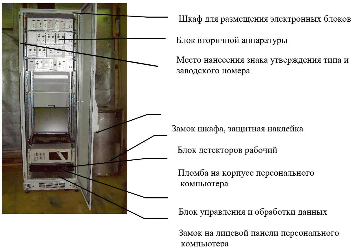
Рисунок 3- Внешний вид модуля электронного

Знак поверки наносится непосредственно на блоки детектирования. Заводской номер наносится типографским способом на прямоугольную фирменную пластинку, размещаемую на левой боковой стенке модуля электронного. Формат нанесения заводского номера буквенно-цифровой.