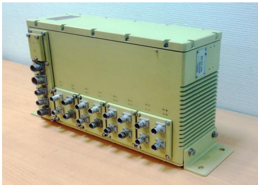
Рисунок 1 Внешний вид