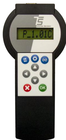
Рисунок 1 – Внешний вид преобразователя с изображением версии программного обеспечения.