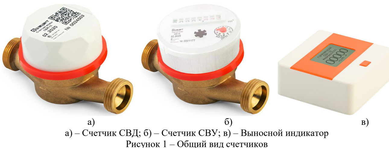
Рисунок 1 – Общий вид счетчиков

Схема пломбировки от несанкционированного доступа, обозначение места нанесения знака поверки представлены на рисунке 2.