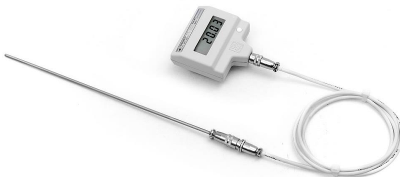
Рисунок 2 – Внешний вид термометра модификаций -Н, -Т, -Ф с разъемным соединением датчика температуры к электронному блоку с помощью кабеля-удлинителя