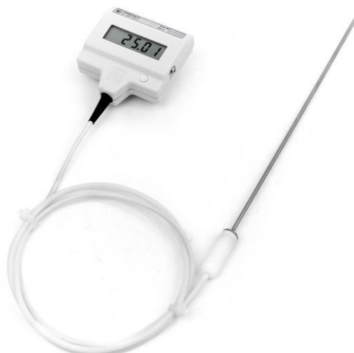
Рисунок 3 – Внешний вид термометра модификаций -Н, -Н-ТС, -Т, -Ф с неразъемным соединением датчика температуры к электронному блоку

Пломбирование термометров не предусмотрено.