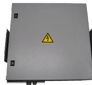
Блок управления и питания