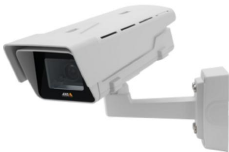
Видеоблок регистрирующий или светофорный тип 1

Внешний вид составных частей систем с указанием мест нанесения знака утверждения типа и пломбирования приведены на рисунках 1, 2, 3.