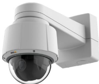
Видеоблок поворотный тип 1