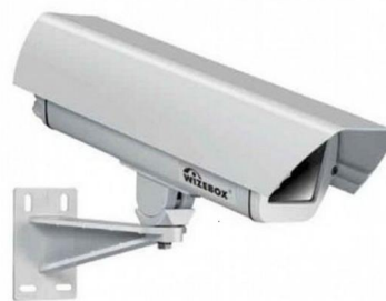
Видеоблок регистрирующий или светофорный тип 2