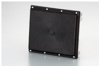
Радарный блок системы