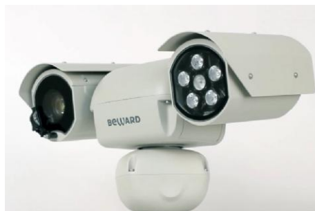
Видеоблок поворотный тип 2