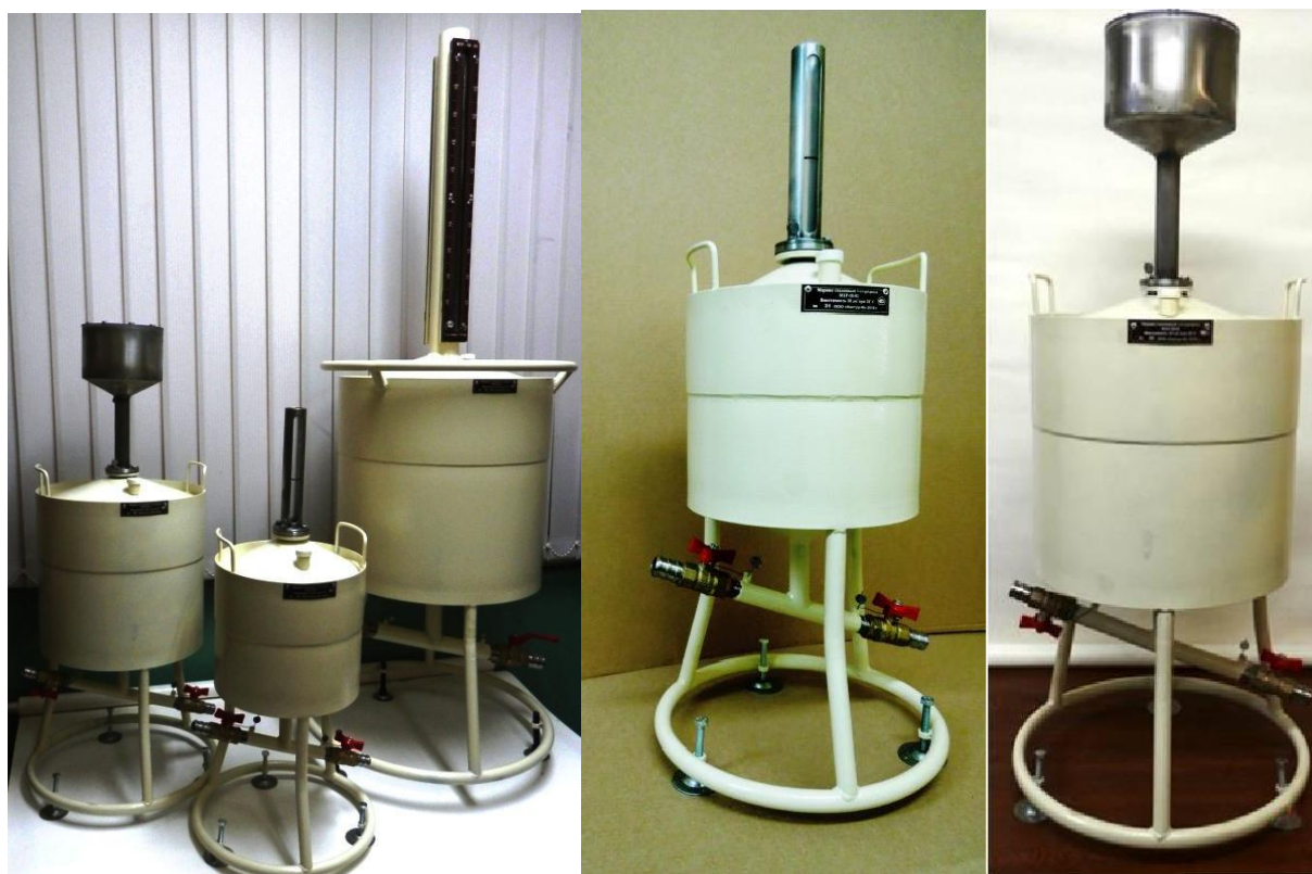
Рисунок 1 – Общий вид мерников металлических эталонных 1-го разряда М1Р

Пломбирование мерников металлических эталонных 1-го разряда М1Р осуществляется нанесением знака поверки давлением на свинцовые (пластмассовые) пломбы, установленные на проволоках, пропущенных через отверстия в сливном и наливном кране, отверстия в болтах на горловине мерника и давлением на мастику, расположенную на винте регулировки шкалы. Схема пломбировки от несанкционированного доступа, обозначение места нанесения знака поверки представлены на рисунках 2 и 3.