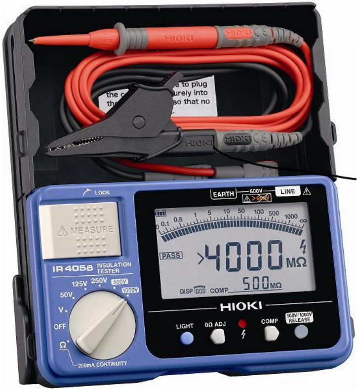
Рисунок 10 – Общий вид мегаомметров HIOKI IR4058