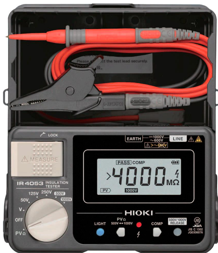
Рисунок 9 – Общий вид мегаомметров HIOKI IR4053