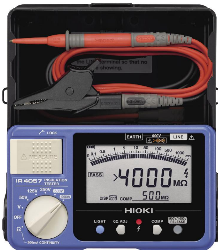
Рисунок 9.2 – Общий вид мегаомметров HIOKI IR4057