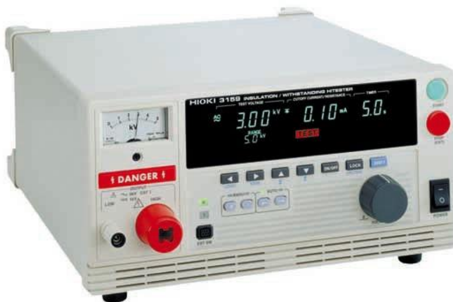
Рисунок 2 – Общий вид мегаомметров HIOKI 3159