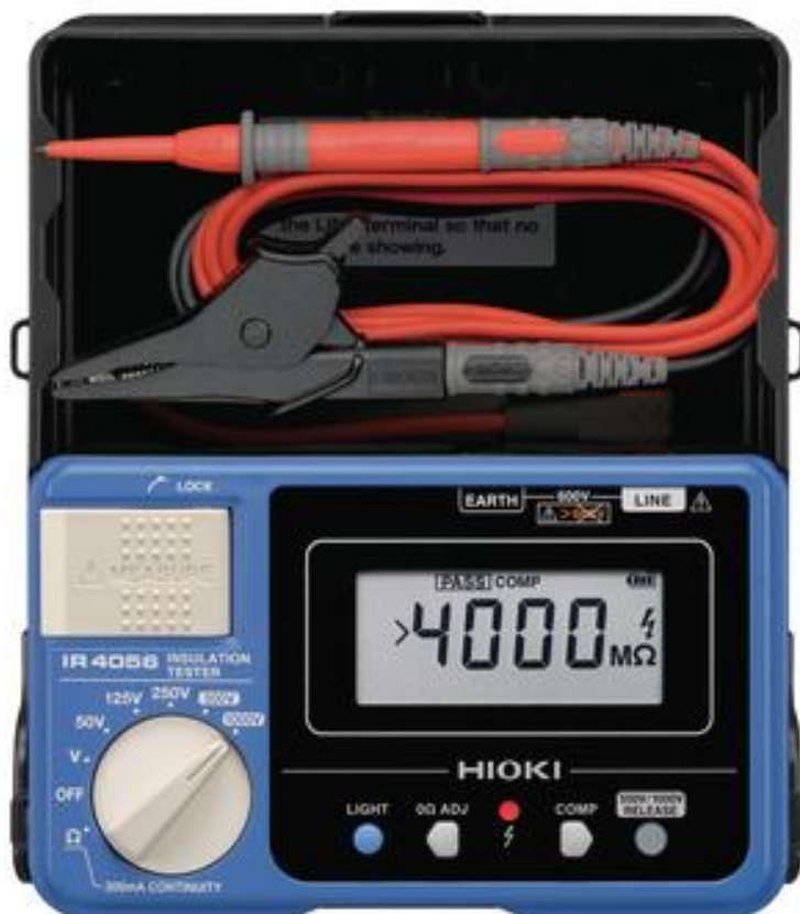
Рисунок 9.1 – Общий вид мегаомметров HIOKI IR4056