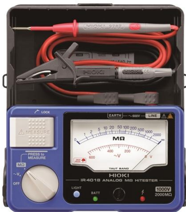
Рисунок 8 – Общий вид мегаомметров HIOKI IR401B