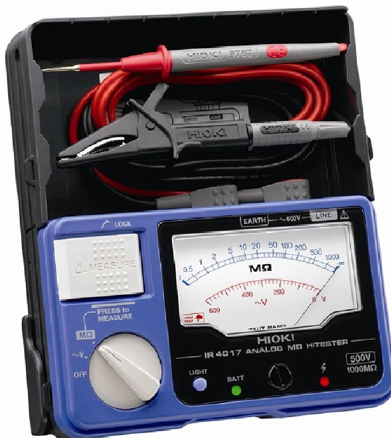
Рисунок 7 – Общий вид мегаомметров HIOKI IR4017