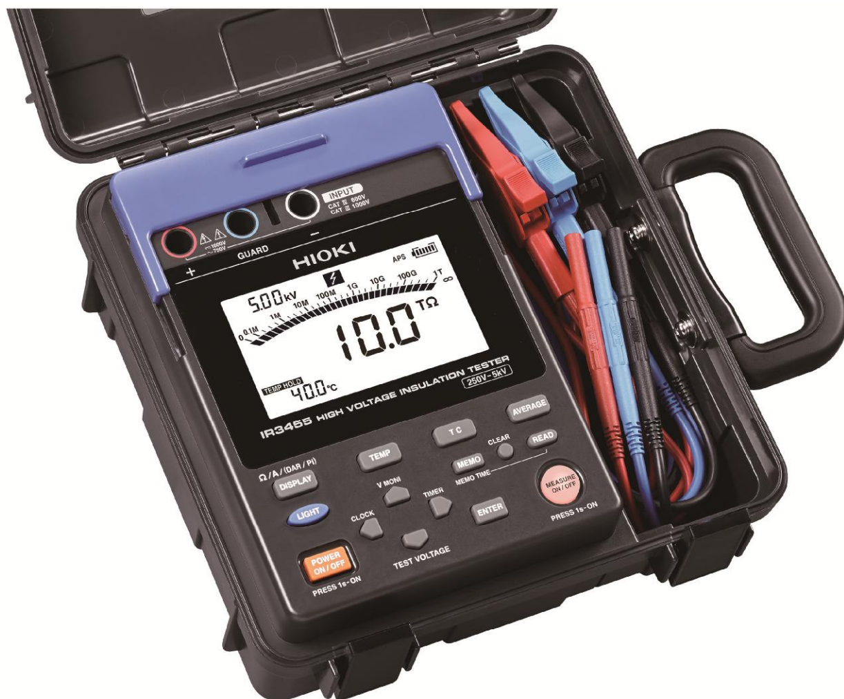
Рисунок 5 – Общий вид мегаомметров HIOKI IR3455