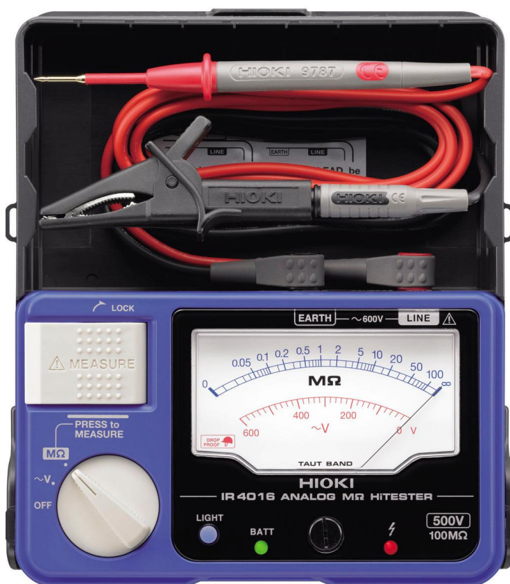
Рисунок 6 – Общий вид мегаомметров HIOKI IR4016