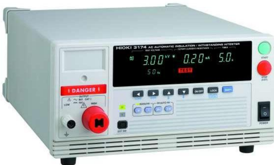
Рисунок 3 – Общий вид мегаомметров НЮКИ 3174