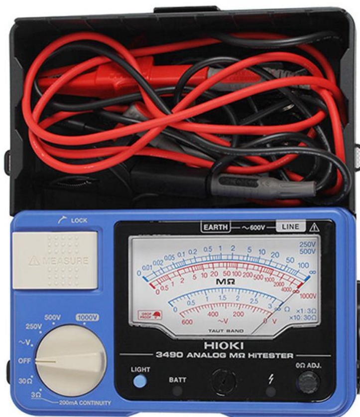
Рисунок 4 – Общий вид мегаомметров НЮКИ 3490