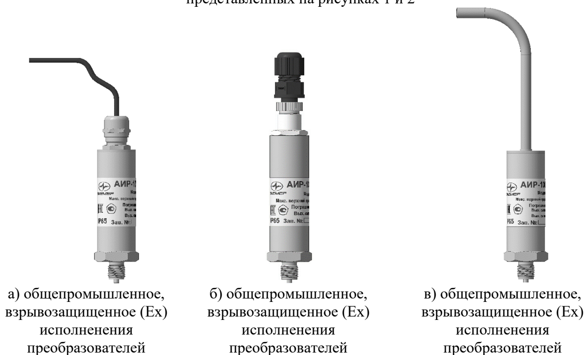
Рисунок 4 – Общий вид преобразователей абсолютного давления, избыточного давления, избыточного давления-разрежения

Пломбирование преобразователей, представленных на рисунке 4, не предусмотрено.