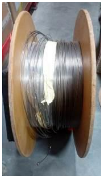
Рисунок 1 - Общий вид волоконно - оптического кабеля

Общий вид средства измерений, схема пломбировки от несанкционированного доступа, обозначение мест нанесения знаков утверждения типа и поверки представлены на рисунках 1-3.