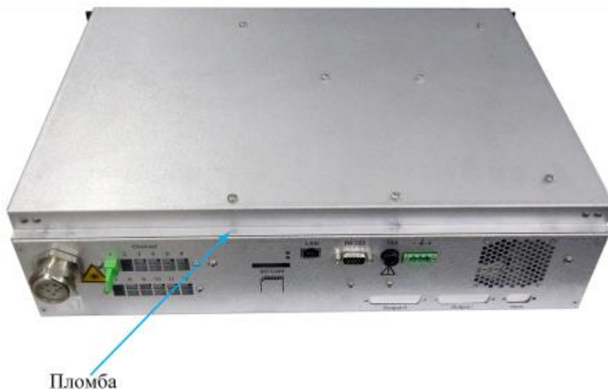
Рисунок 2 - Общий вид задней панели измерительного блока с указанием места установки пломбы