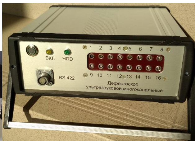
Рисунок 2 – Общий вид блока системного ДУМ.СК26