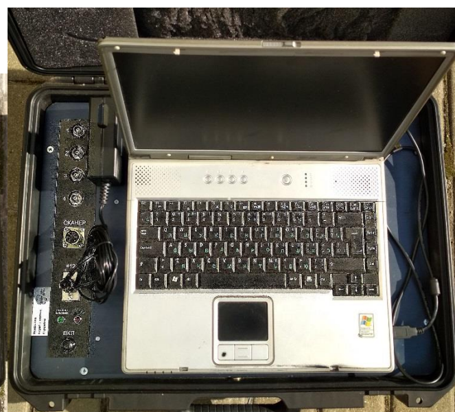
Рисунок 4 – Общий вид блока системного БС.БРД-УТ