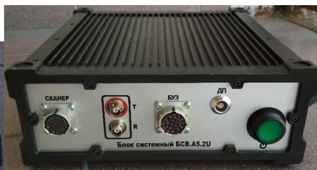
Рисунок 3 – Общий вид блока системного БСВ.А5.2U