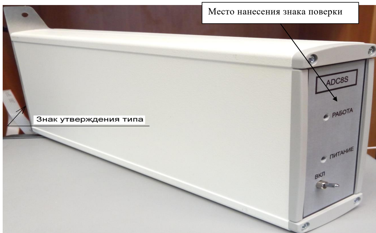
Рисунок 2 - Внешний вид модуля СЕМШ10.1108.00.00