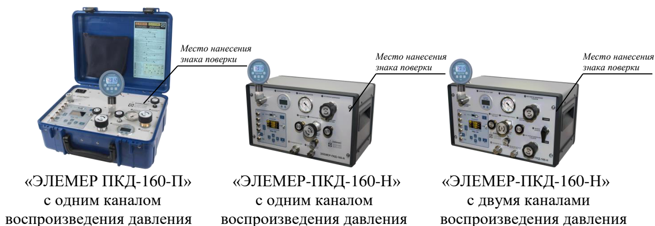
Рисунок 1 – Общий вид калибраторов давления портативных «ЭЛЕМЕР-ПКД-160» и обозначение места нанесения знака поверки

Схемы пломбировки от несанкционированного доступа представлены на рисунке 2.