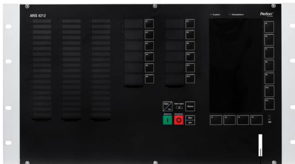
б) Вид спереди