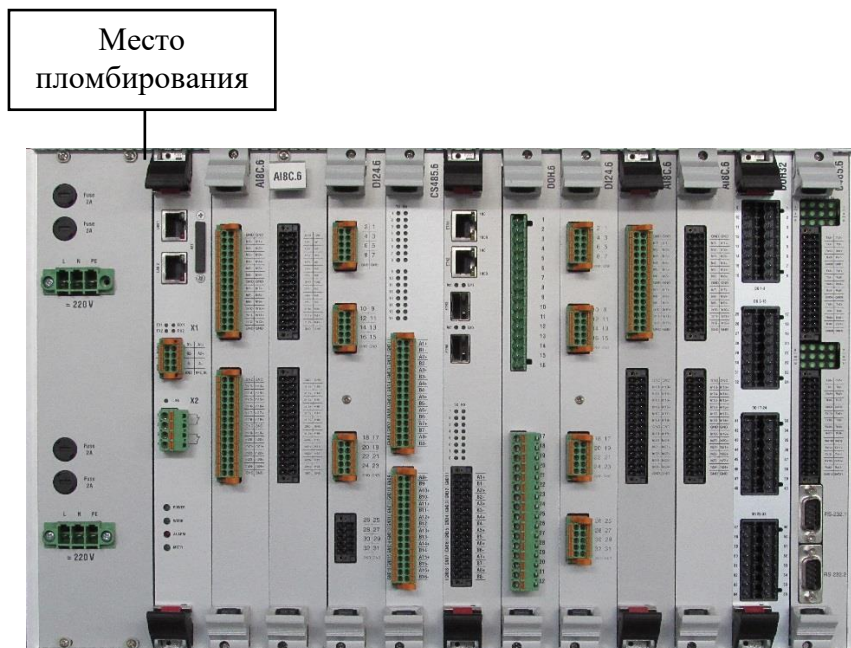
а) Вид сзади