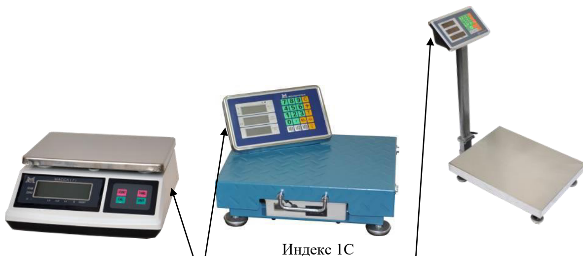
Схема пломбировки от несанкционированного доступа и обозначение места нанесения знака поверки представлены на рисунке 3.

Общий вид весов различных конструктивных исполнений показан на рисунках 1 и 2.