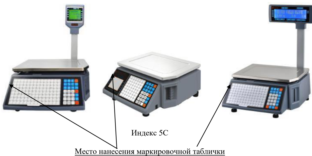
Рисунок 2 – Общий вид весов