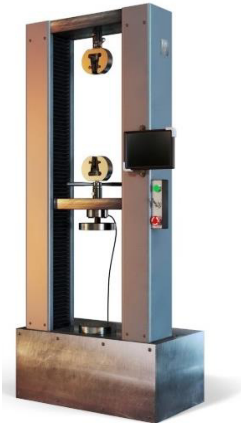
Рисунок 3 - Машины испытательные универсальные серии РКМ исполнений РКМ 5.2, РКМ 10.2, РКМ 20.2, РКМ 50.2, РКМ 100.2 с пультом оператора