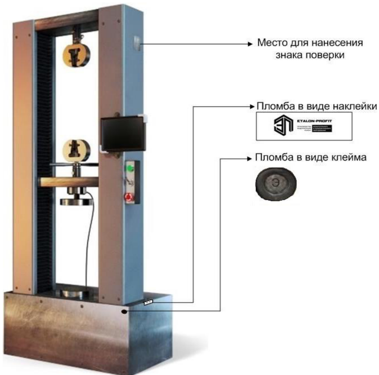
Рисунок 8 - Схема нанесения знака поверки и пломбирования машин серии РКМ исполнений РКМ 5.2, РКМ 10.2, РКМ 20.2, РКМ 50.2, РКМ 100.2 от несанкционированного доступа