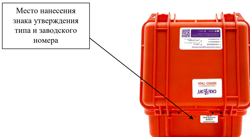
Рисунок 2 – Место нанесения знака утверждения типа и заводского номера