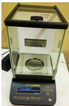
Общий вид модификации ВЛА-xxxМ