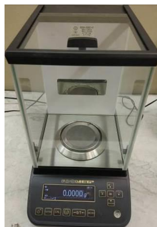
Общий вид модификаций ВЛА-xxx, ВЛА-xxxС, ВЛА-xxxС-О