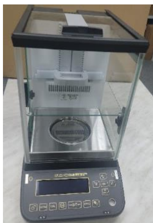
Общий вид модификации ВЛА-xxxМА (исполнение с автоматизированной витриной и регулируемым по высоте внутренним ветрозащитным экраном)