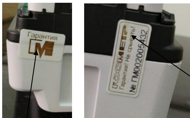
Схема пломбирования контрольными этикетками