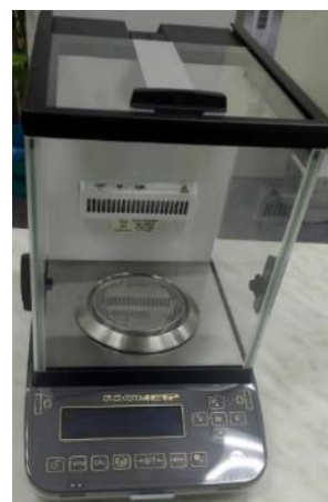
Общий вид модификаций ВЛА-220С-ОА, ВЛА-320С-ОА (исполнение с автоматизированной витриной)