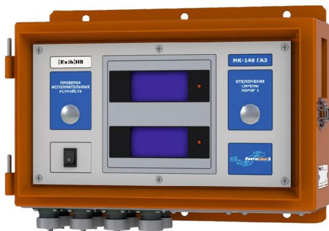
Рисунок 4 - Модуль коммутации МК-140 ГАЗ