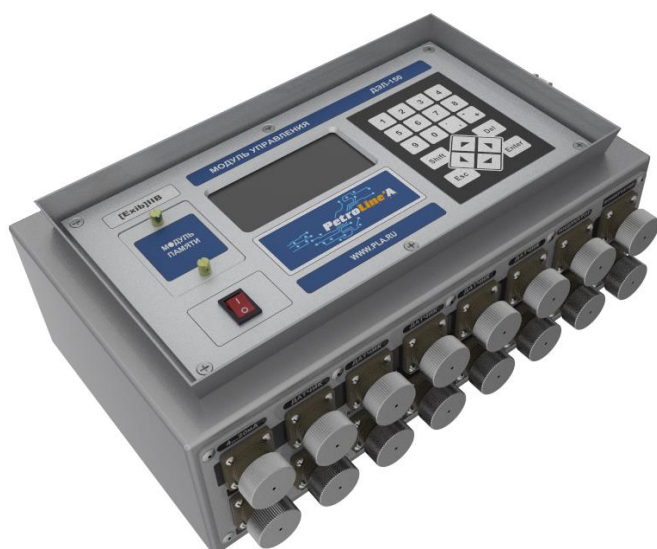
Рисунок 2 - Модуль управления МУ-150 / МУ-150(Е)