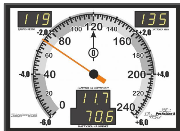
Рисунок 7 – Модуль индикации МИ-140С

Пломбирование СКПБ ДЭЛ-150 не предусмотрено.