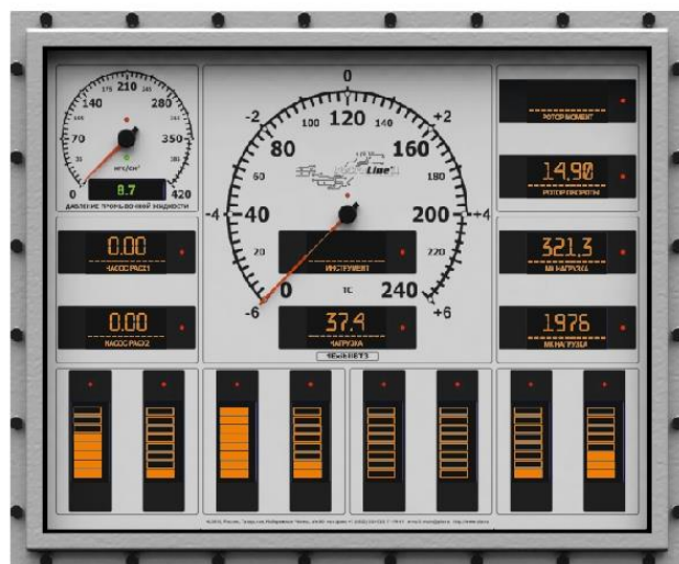
Рисунок 6 – Модуль индикации МИ-140