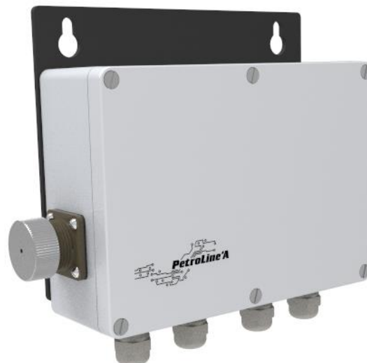
Рисунок 5 - Преобразователь сигналов ПС-150