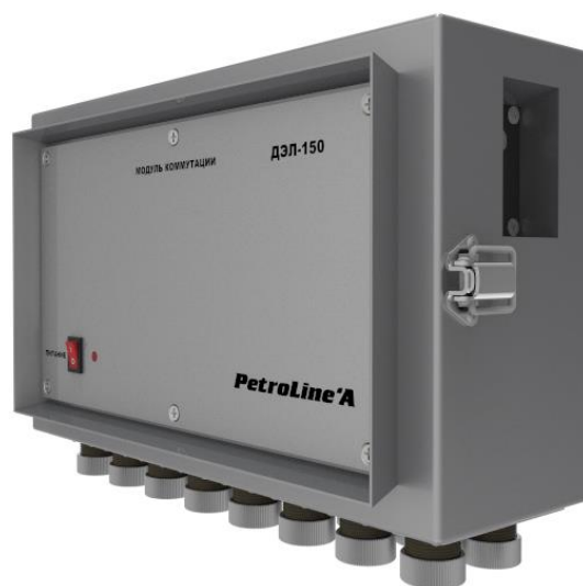
Рисунок 3 - Модуль коммутации МК-140