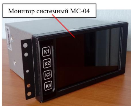
б) исполнение 02