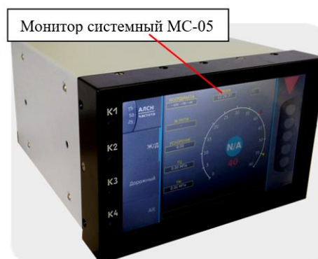
в) исполнение 03