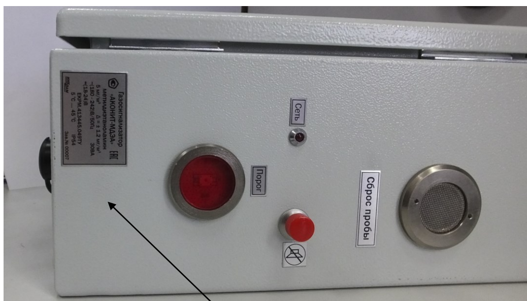
Место нанесения знака поверки