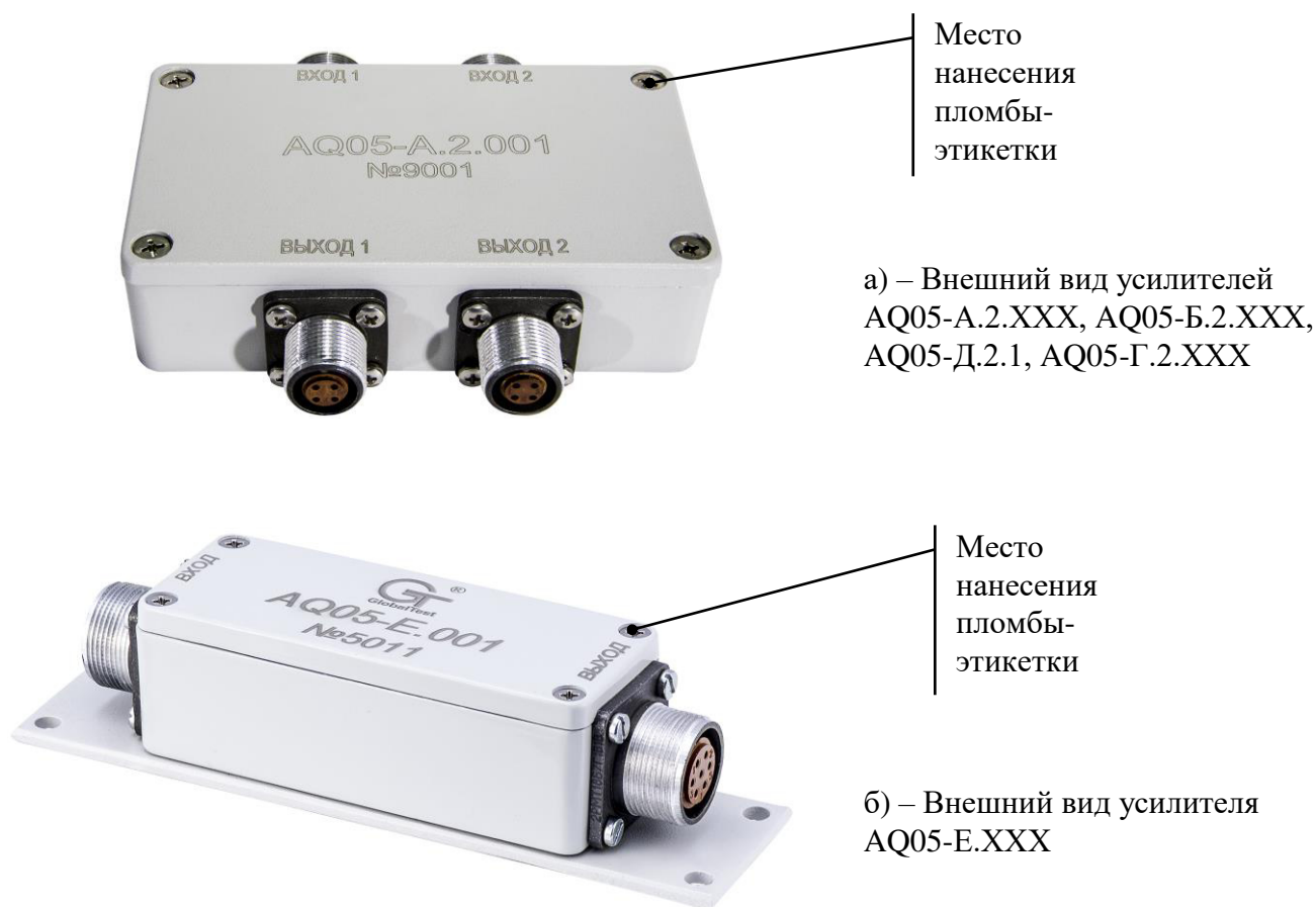
Рисунок 2 – Внешний вид усилителей дифференциальных AQ05