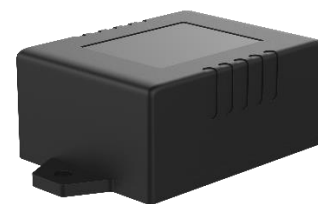
В) Устройство сбора и передачи данных RWCS-3903