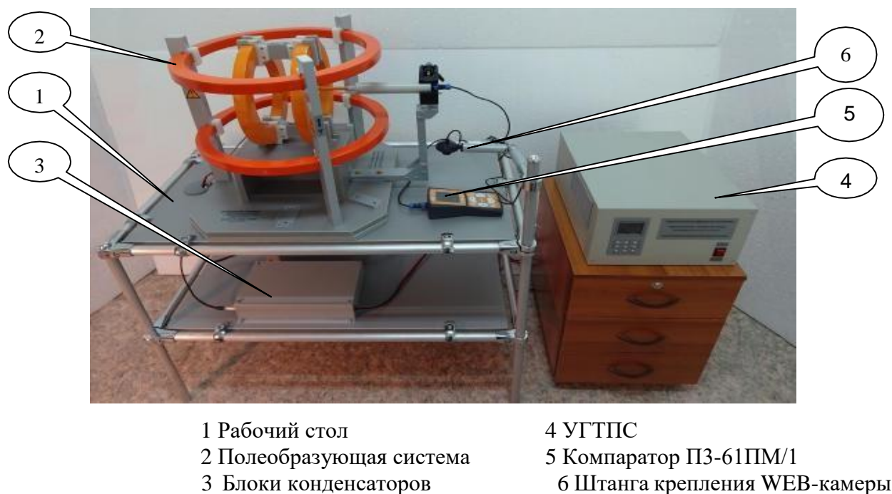
Рисунок 1 - Общий вид установок

Схема пломбировки от несанкционированного доступа, обозначение места нанесения знака утверждения типа и заводского номера представлены на рисунках 2 и 3.