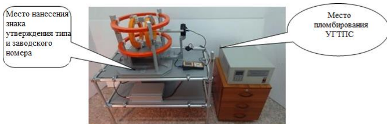
Рисунок 2 - Схема пломбировки от несанкционированного доступа, обозначение места нанесения знака утверждения типа и заводского номера установок УТПС