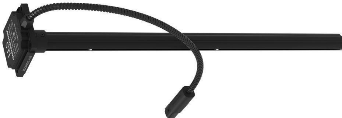
Рисунок 1 – Общий вид средства измерений

Общий вид средства измерений представлен на рисунке 1.