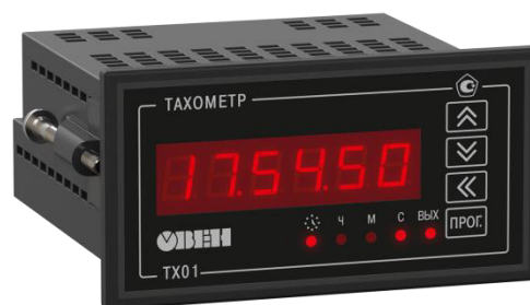
Рисунок 3 - Общий вид счетчиков в корпусе для щитового (Щ2) крепления

Пломбирование счетчиков не предусмотрено.