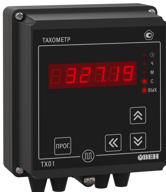
Рисунок 2 - Общий вид счетчиков в корпусе для настенного (Н) крепления

Общий вид счетчиков представлен на рисунках 2 и 3.