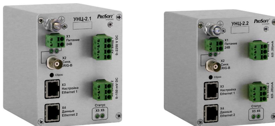
Рисунок 3 – Общий вид измерительных преобразователей УНЦ-2.1 и УНЦ-2.2