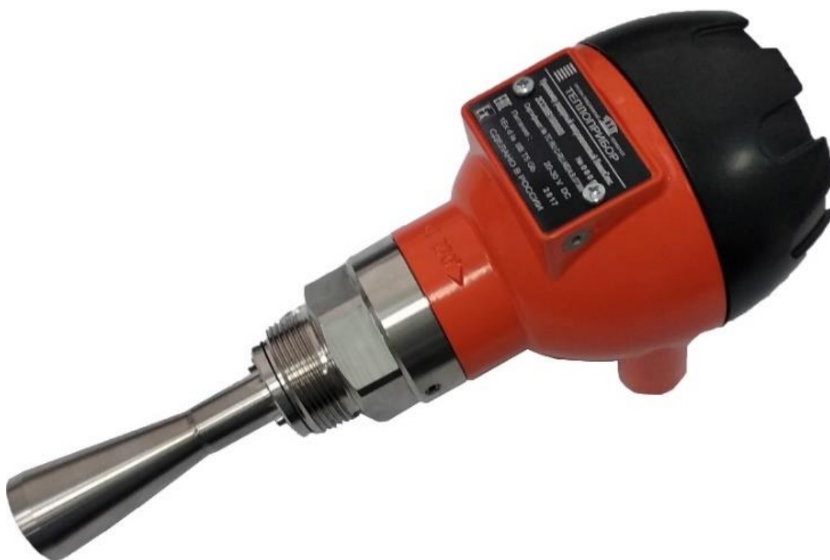
Рисунок 1 – Общий вид уровнемера

Общий вид уровнемеров представлен на рисунках 1, 2.