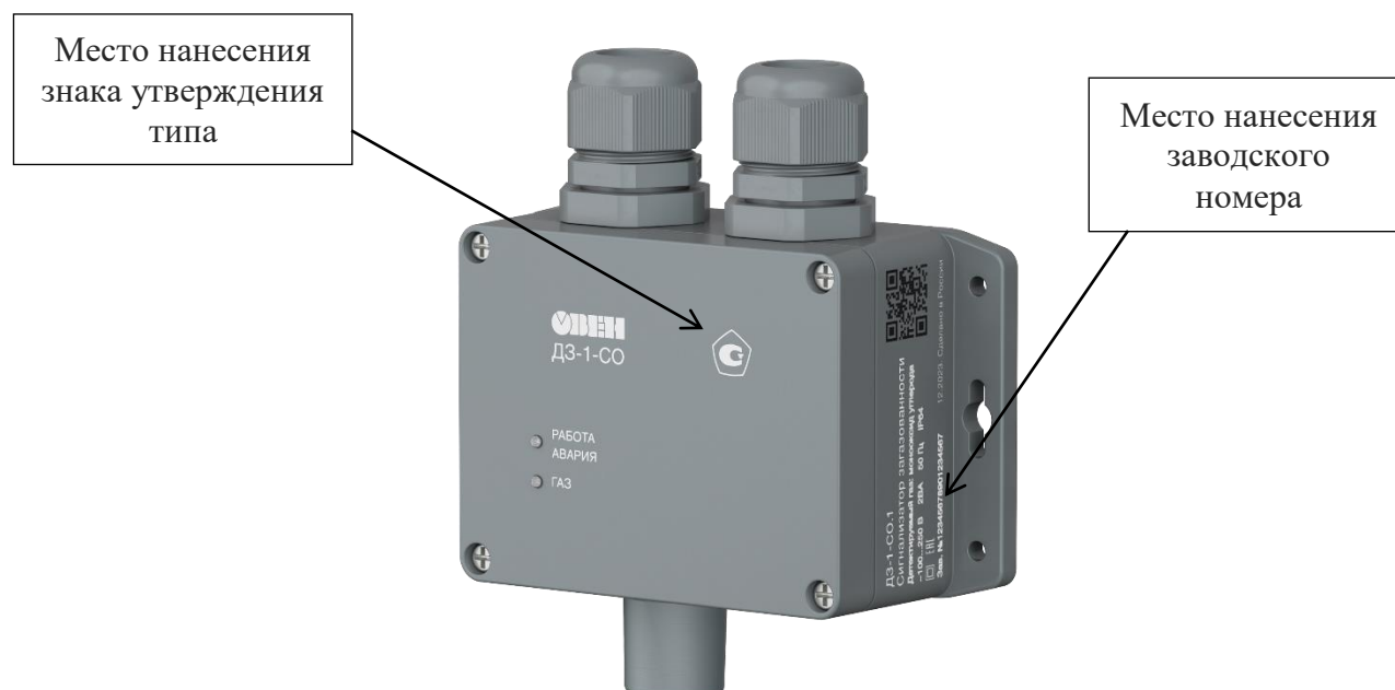
Рисунок 3 – Общий вид сигнализаторов исполнения ДЗ-1-СО.1