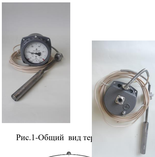
Рис.1-Общий вид тер