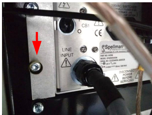
Чашка для пломбирования на задней панели ВИП