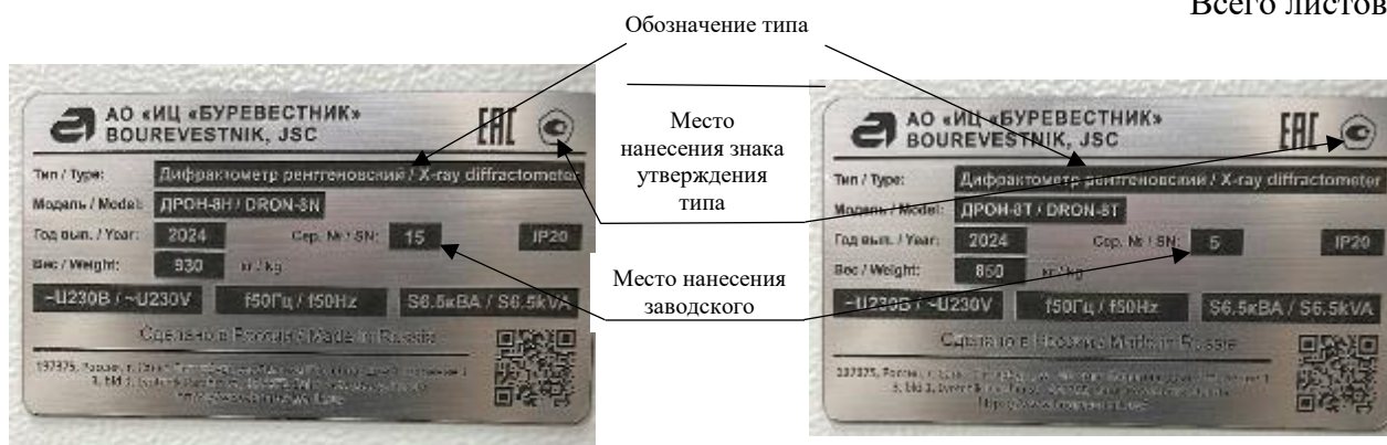
Рисунок 3 – Вид планки фирменной (шильдика) с обозначением типа и заводским номером дифрактометров рентгеновских моделей ДРОН-8Н и ДРОН-8Т