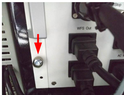
Чашка для пломбирования на задней панели БУСД