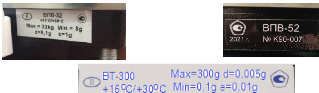
Рисунок 3 – Пример маркировки весов