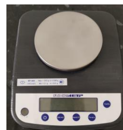
Весы серии ВТ