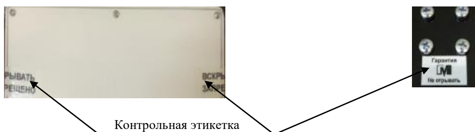
Рисунок 2 - Схема пломбирования от несанкционированного доступа

Серийный номер и буквенно-цифровое обозначение модификации приведено на маркировочной табличке в виде наклейки, расположенной на задней стенке основания весов. Пример маркировки приведен на рисунке 3.