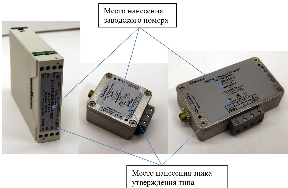
Рисунок 2 – Общий вид согласующих усилителей приборов ВК-306