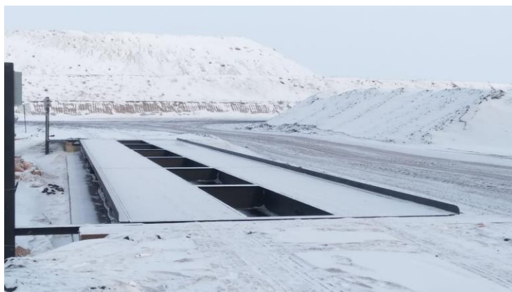
Рисунок 1 - Общий вид весов ВСА

Общий вид весов представлен на рисунке 1.