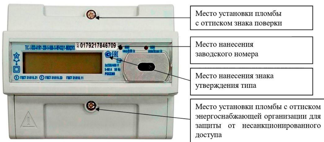
Рисунок 4 – Общий вид счетчика в корпусе типа D33