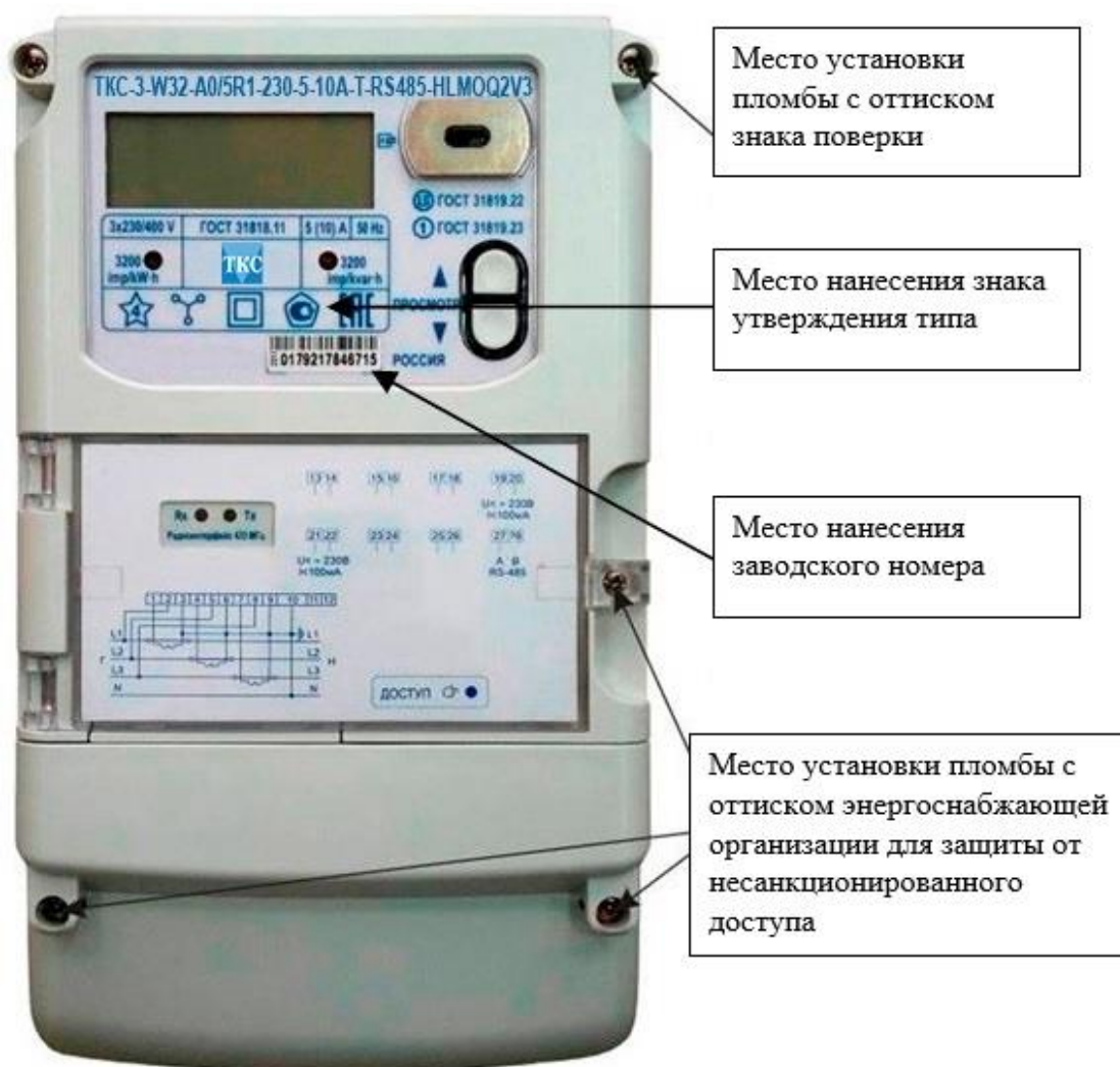
Рисунок 2 – Общий вид счетчика в корпусе типа W32