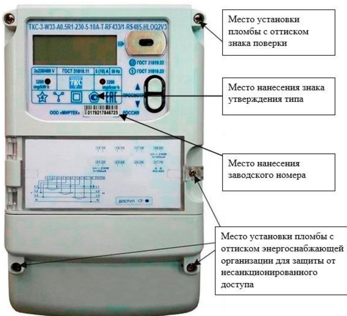
Рисунок 3 – Общий вид счетчика в корпусе типа W33