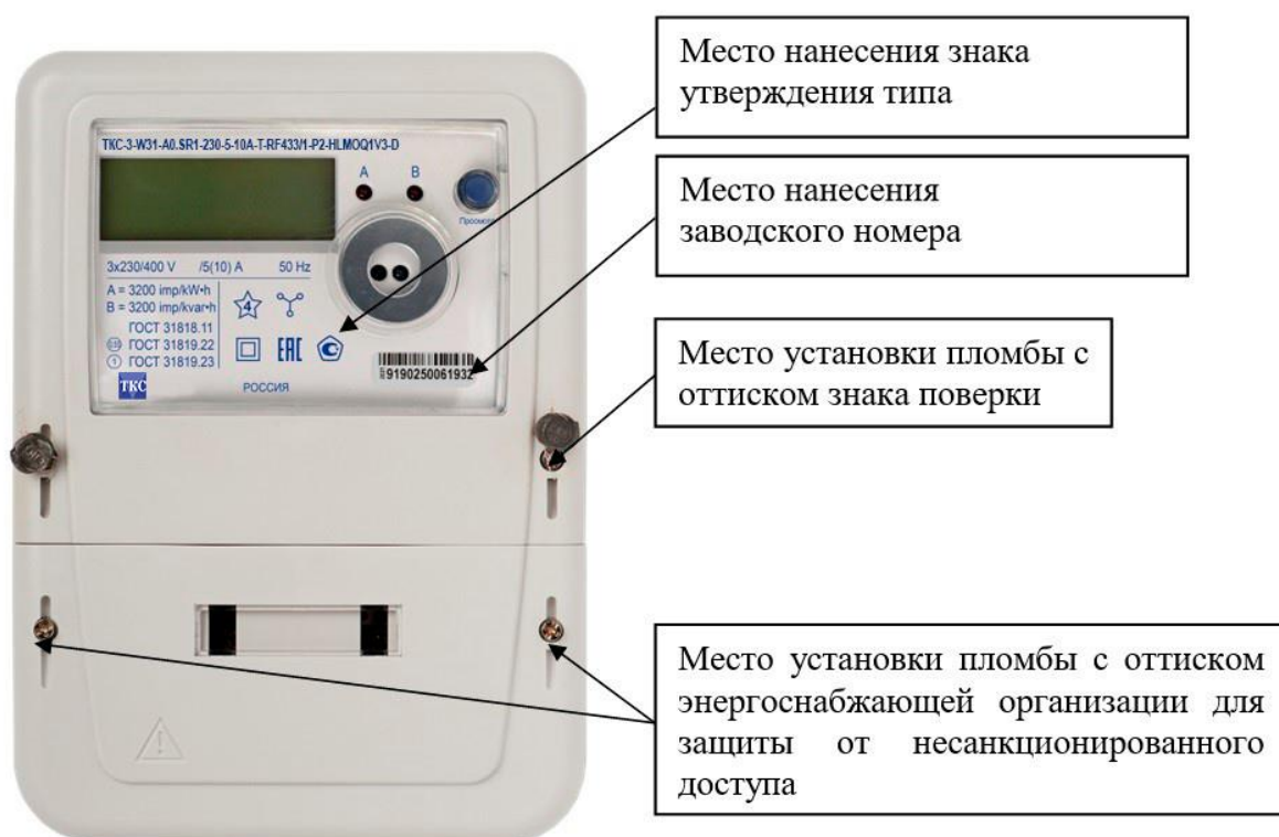
Рисунок 1 – Общий вид счетчика в корпусе типа W31