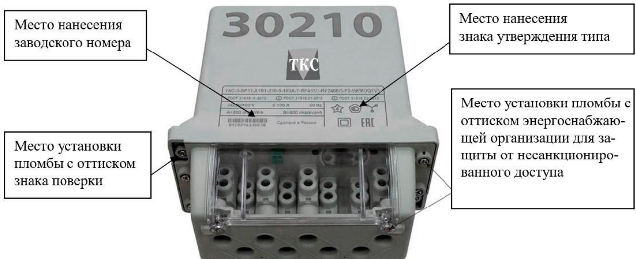
Рисунок 7 – Общий вид счетчика в корпусе типа SP31