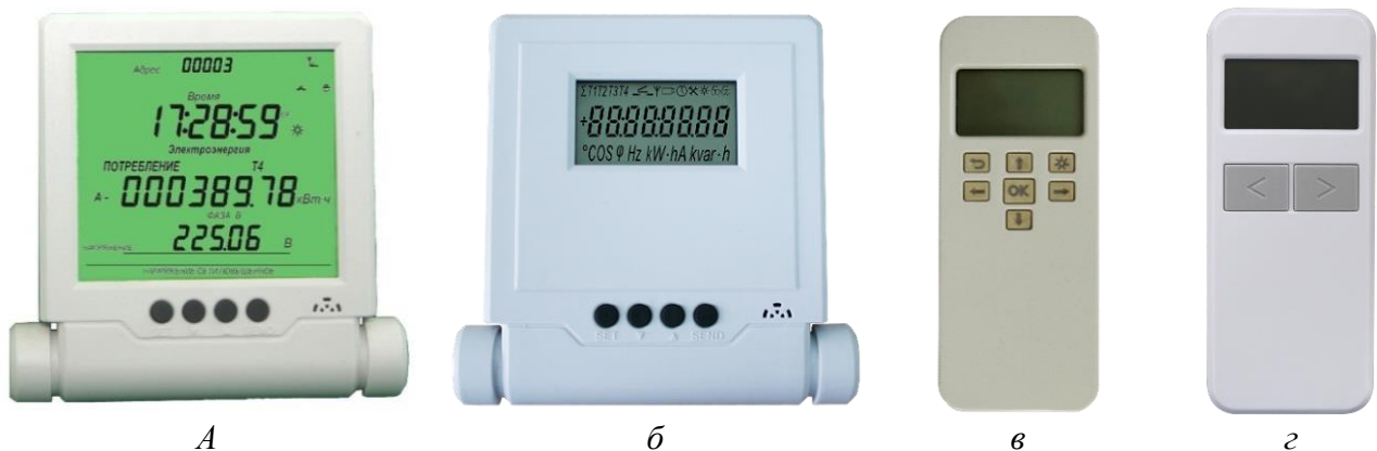
Рисунок 8 – Общий вид дистанционного индикаторного устройства