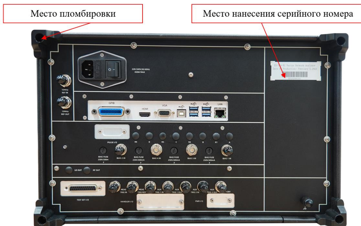
Рисунок 2 - Схема пломбировки от несанкционированного доступа и место нанесения серийного номера, идентифицирующего каждый экземпляр СИ